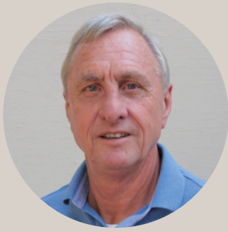
Johan Cruijff Grondlegger

Johan Cruijff wist als geen ander dat sporters een aantal specifieke kwaliteiten bezitten, zoals betrokkenheid en prestatie- en doelgerichtheid. Met dergelijke kwaliteiten en via onze 'Cruyffiaanse' opleidingen, kunnen zij succesvolle professionals worden in de sportwereld. Want aldus Johan: "Niemand kan de belangen van de sport beter dienen dan iemand met het hart van een sporter."