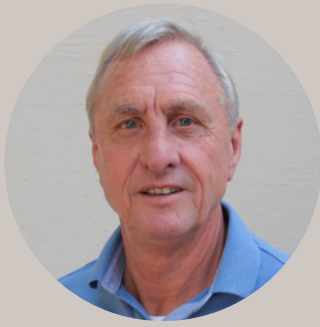
Johan Cruyff Oprichter

Johan Cruyff wist als geen ander dat sporters een aantal specifieke kwaliteiten bezitten, zoals betrokkenheid en prestatie- en doelgerichtheid. Met dergelijke kwaliteiten en via onze 'Cruyffiaanse' opleidingen, kunnen zij succesvolle professionals worden in de sportwereld. Want aldus Johan: Niemand kan de belangen van de sport beter dienen dan iemand met het hart van een sporter.